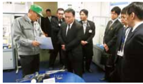
プロフェッショナル人材を活用し、海外展開するシグマ株式会社を視察