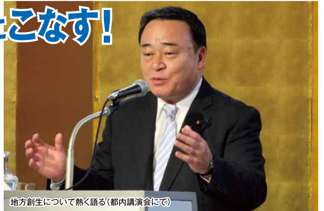
地方創生について熱く語る(都内講演会にて)

梶山ひろしは平成29年8月3日の大臣就任以来、11か月が経過。地方創生以外にも内閣で多岐の役割を担って精力的に活動しています。