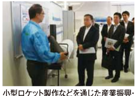
小型ロケット製作などを通じた産業振興・人材育成の取組を行っている、信州大学諏訪園サテライトキャンパスを視察