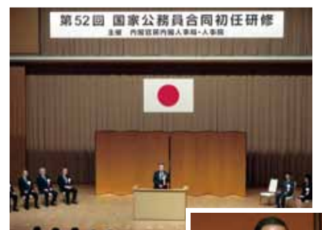
第52回国家公務員合同初任研修閉講式で訓示(4月6日)

梶山ひろしは、国家公務員の人材育成や時代のニーズに合った意識改革を進める責任者です。