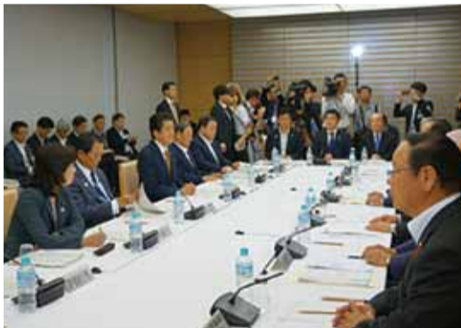
国と地方の協議の場で議論をリード(5月29日)

梶山ひろしは地方創生の司令塔として、地方の雇用の創出、地域の活力の再生を担っています。