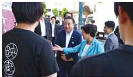
栃木市で地域おこしに力を入れる蔵の街大通りを視察