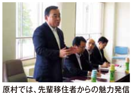
原村では、先輩移住者からの魅力発信や生活体験の実施などによる移住・定住促進の取組について意見交換