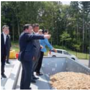
川場村木質バイオマス発電施設視察