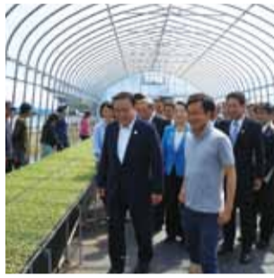
昭和村で農園星ノ環のレタス畑を視察、関係者と意見交換