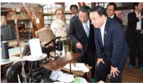
行田市で「ふるさと名品オブサイヤー」の「地方創生賞」にも選出された「サムライ足袋」の取組等を視察