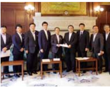
党地方創生実行統合本部からの提言を受ける(6月8日)

梶山ひろしは、閣僚として政府の考えを訴えるとともに、党内で政策実現への働きかけを続けています。