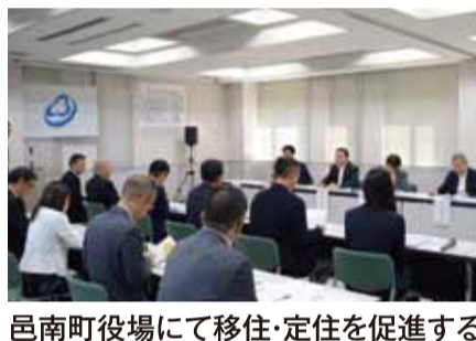
邑南町役場にて移住・定住を促進する取組を地域おこし協力隊、役場定住支援担当と意見交換