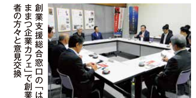
創業支援総合窓口の「はままつ企業カフェ」で創業者の方々と意見交換