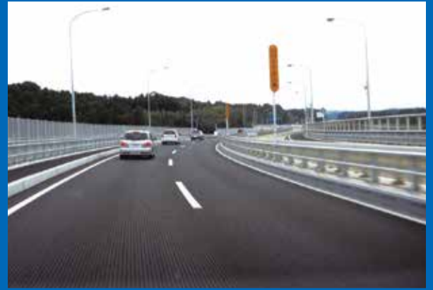
片側2車線の4車線化で渋滞解消へ