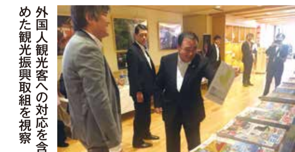
外国人観光客への対応を含めた観光振興取組を視察