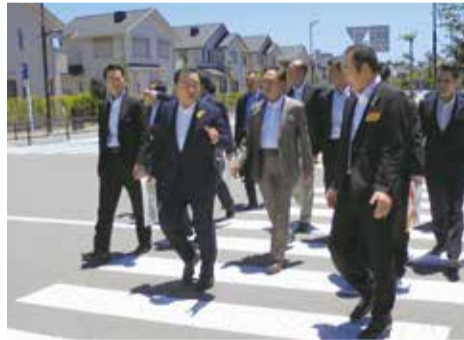
「SDGs未来都市」の先導モデル事業が行われる藤沢SSTを視察