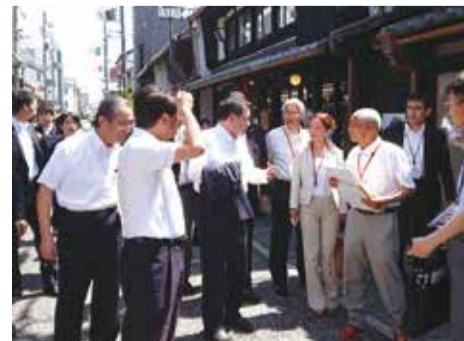
シャッター通りが県内随一の商業観光地に生まれ変わった長浜市黒壁スクエア周辺を視察