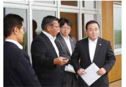
藤崎町ならではの食材、料理を楽しめる「ふじさき食彩テラス」で説明を受ける