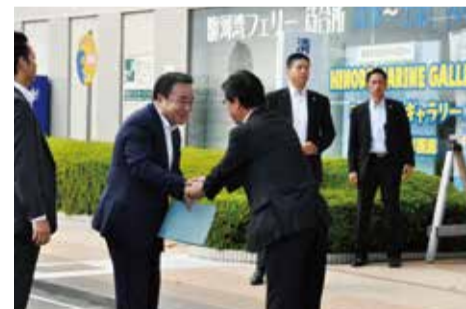
静岡市では大幅に増加している清水港への客船寄港状況や港の整備状況を視察