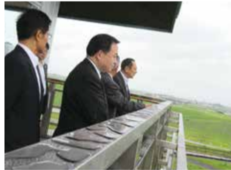
道の駅いなかだて「弥生の里展望所」より田んぼアートを視察