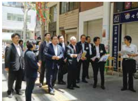
宝石専門学校が商店街に立地する特色を活かし活性化に取り組み甲府城南商店街を視察