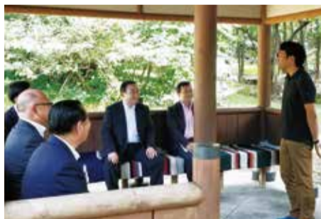
田沢湖キャンプ場で国家戦略特区の特例を活用した自然体験メニューを視察