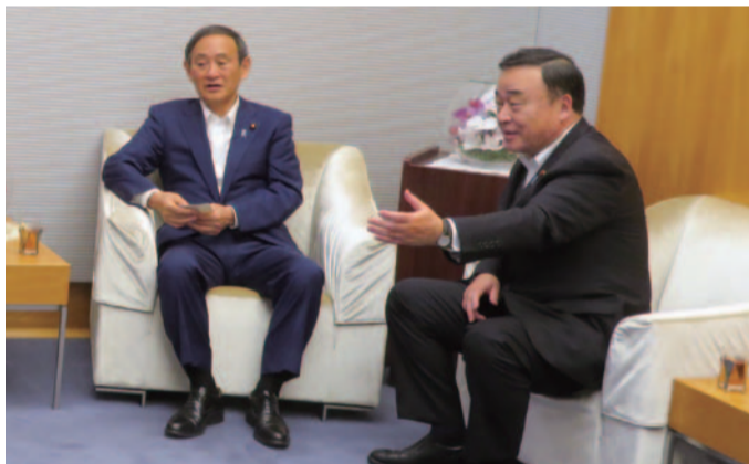
官邸にて菅官房長官へ予算要望(5.16)