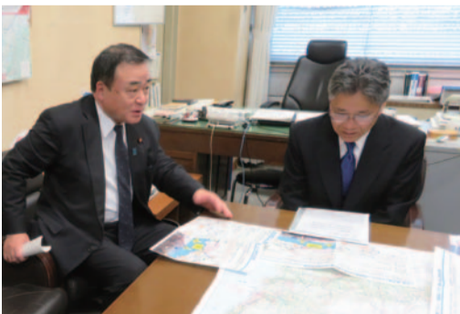
国土交通省道路局へ予算要望(3.15)