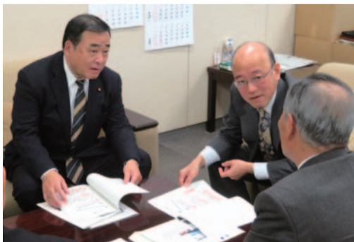
総務省へ特別交付税要望(2.6)