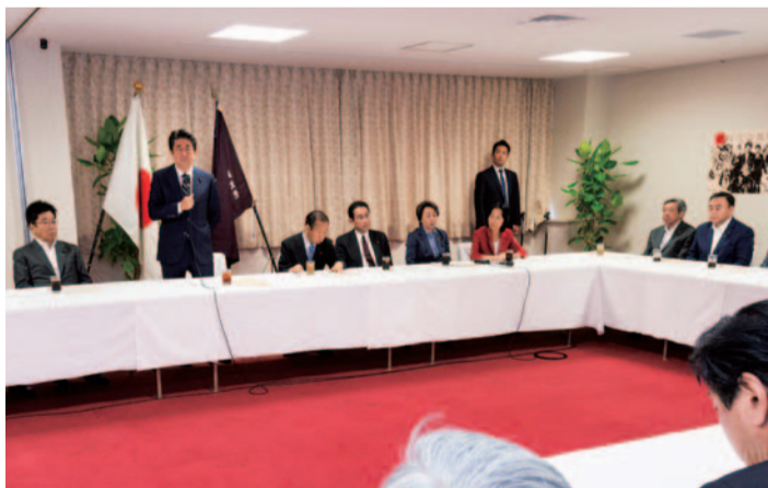
第25回参議院議員通常選挙自民党選挙対策本部会議(6.26)

7月21日に投開票された第25回参議院議員通常選挙は、「政治の安定」を最大の争点として戦いました。