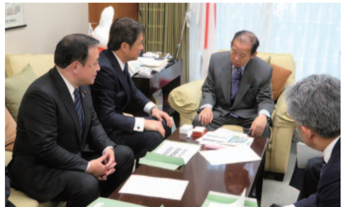
大井川知事と二階幹事長への要望(2.13)