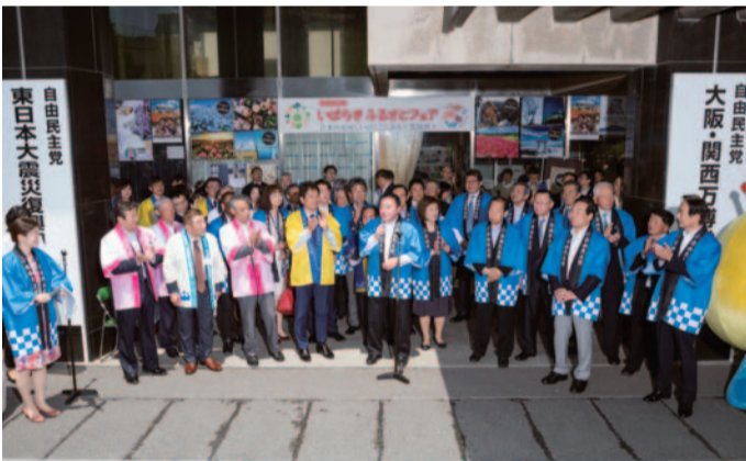
自民党本部「いばらきふるさとフェア」(5.22)