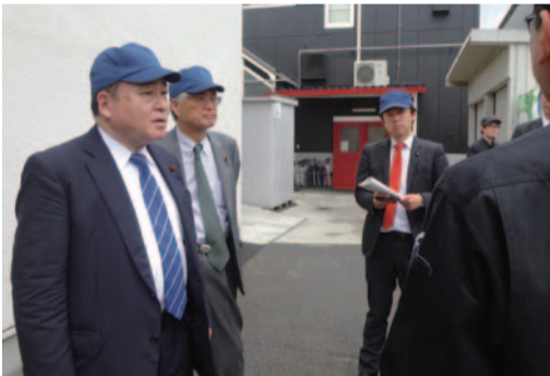
経済産業委員会さいたま市視察(4.24)