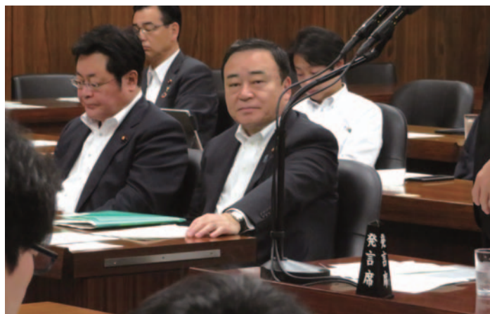
衆議院経済産業委員会 委員会室筆頭理事席にて(6.12)