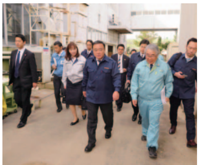
福島県被災地での実情把握に努める