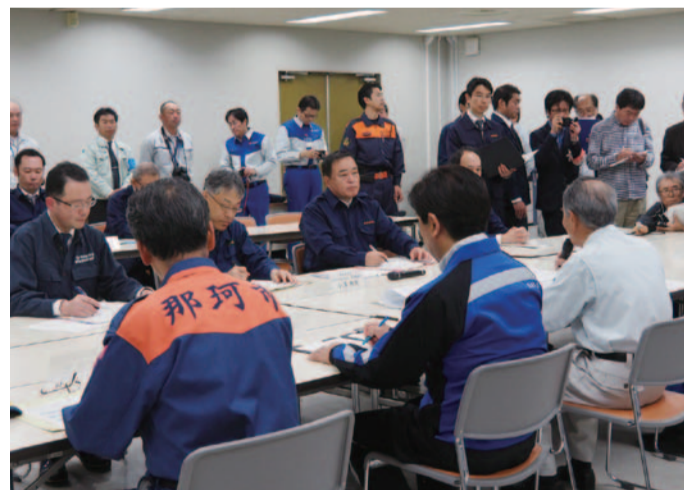
茨城県知事、市町村長らから台風被害の訴えを聞く