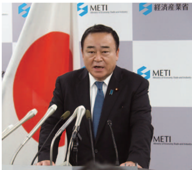
大臣として記者会見

わが国の経済の成長戦略、通商政策などの舵取りを担うとともに、台風15号および台風19号で被災された地域への復旧・復興に全力で取り組んでいます。