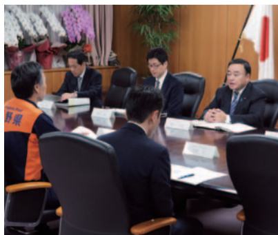
長野県知事から災害支援の要望を受ける