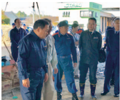
地元被災現場を精力的に視察