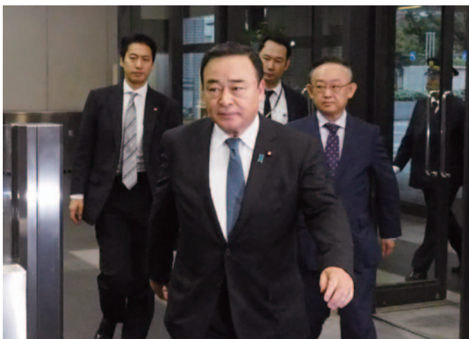
経済産業大臣として初登庁