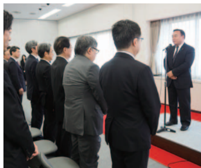
職員に新大臣として挨拶