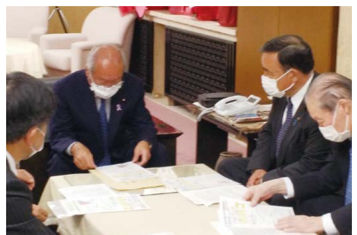
財務大臣に道路整備予算の確保を要望(11/18)