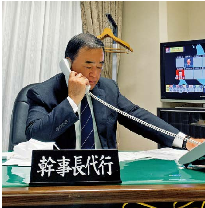
投票終了後、幹事長代行室に入り全国の選挙情勢を確認する(10/31)