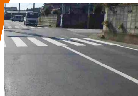
常陸那珂港山方線舗装繕繕工事 (那珂市南酒出)