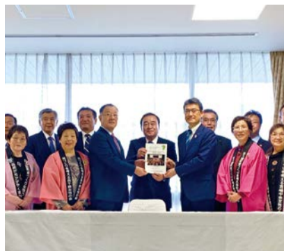
九州中央自動車道建設促進協議会(10/19)