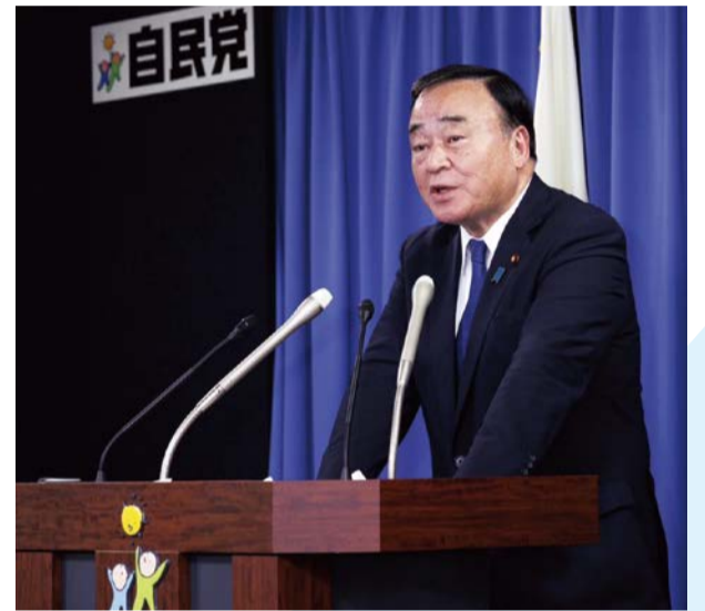
政府与党連絡会議後の記者会見(11/21)