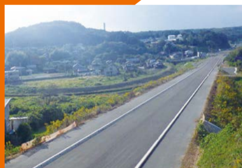
国道293号道路改良工事 (常陸太田市増井町)