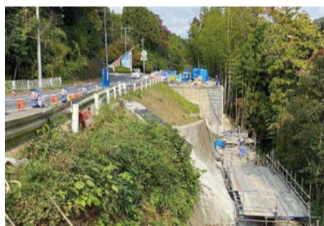
大子線道路改良工事 (常陸太田市天下野町)