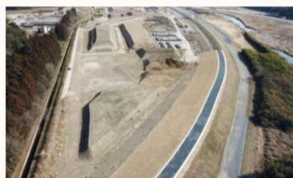
常陸大宮市大場遊水地 堤防整備