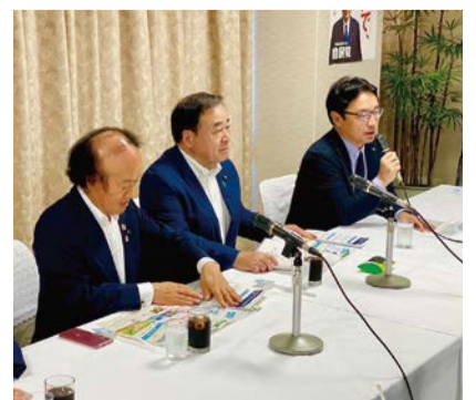
徳島県連・徳島県議会要望(8/22)