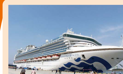
ダイヤモンドプリンセス初寄港 (4/21)