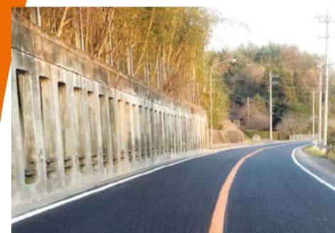
国道123号舗装繕繕工事 (常陸大宮市金井)