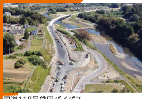
国道118号袋田バイパス 北田気大橋 (大子町北田気)