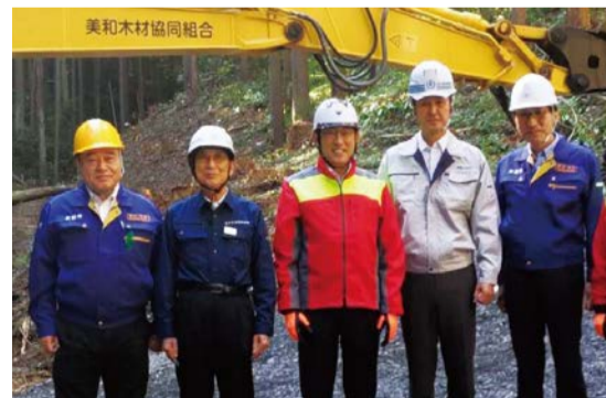
常陸大宮市を岸田総理が視察(10/7)