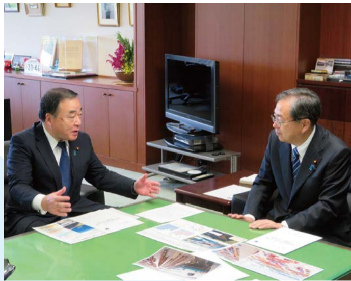
常陸那珂港整備促進を斉藤国土交通大臣に要望(10/18)

となるカーボンニュートラル・DX戦略の責任者を務め、安全・安心な地域をつくるため、地元のご要望にもしっかり対応して参ります。