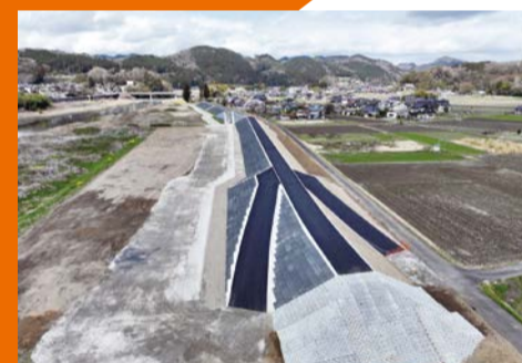
久慈川堤防整備 (常陸大宮市西野内)