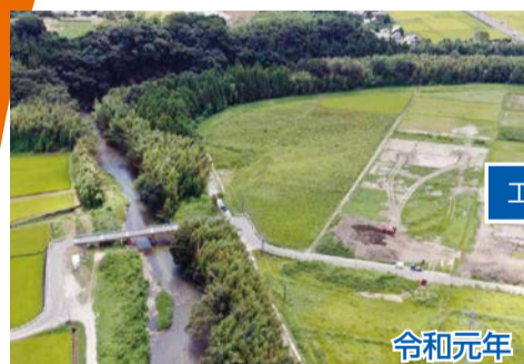
里川河川改修工事 (常陸太田市常福地町、茅根町)