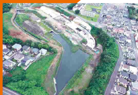
中丸川調整池整備 (ひたちなか市中根、長堀町)