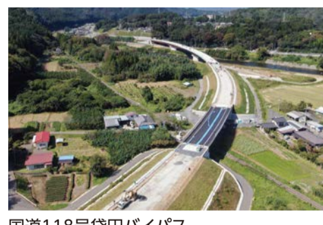
国道118号袋田バイパス 南田気跨線橋 (大子町南田気)