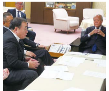
公共工事有志の会 財務大臣要望(10/6)