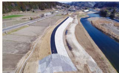
常陸大宮市舟生 堤防整備