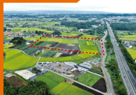
那珂インターチェンジ周辺「道の駅」整備計画