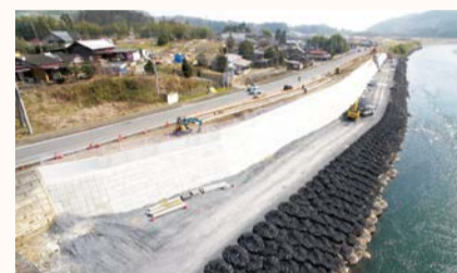
常陸大宮市野口 堤防整備