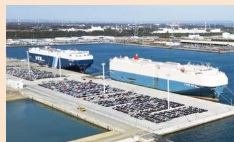
7万トン級RORO船等の接岸、大型船2隻 同時着岸も可能に