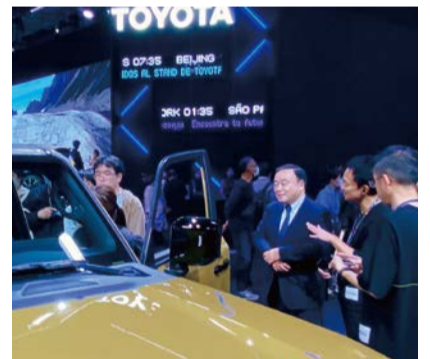
ジャパンモビリティショー(10/27)