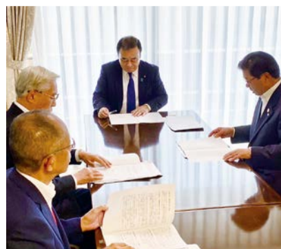
四国経済連合会要望(9/26)