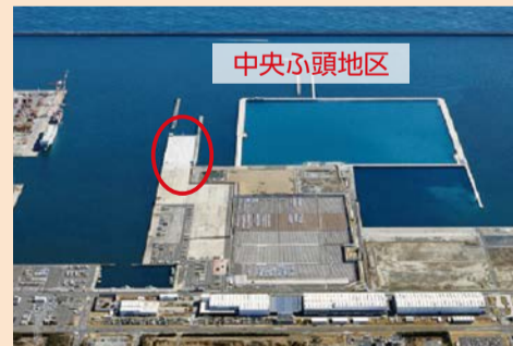
常陸那珂港中央ふ頭D岸壁 延長300mで完成・供用開始