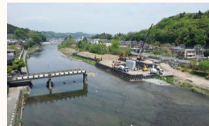
大子町 松沼橋新設下部工事